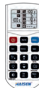
960005 MANDO DE CONTROL REMOTO HD05R COMANDO DE CONTROLE REMOTO HD05R